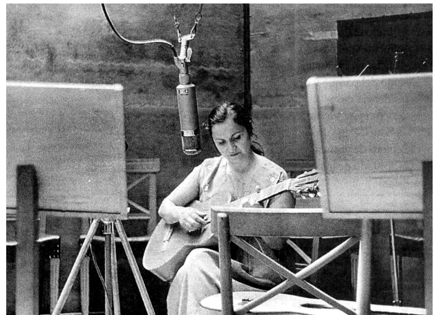
Grabando en Santiago en 1957