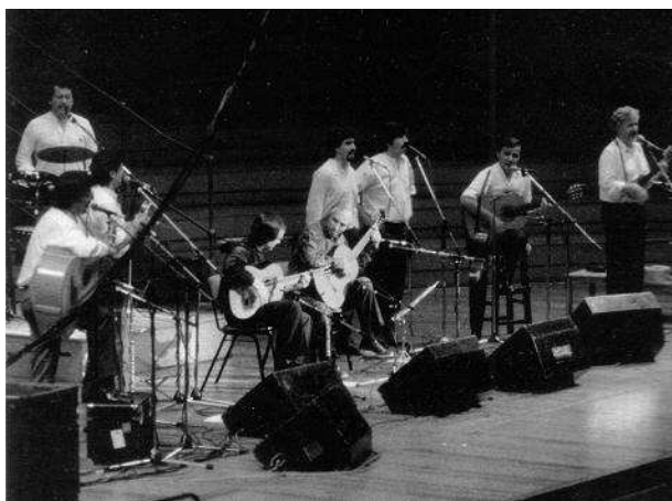
Inti-Illimani con Paco Peña y John Williams, 1987

"En Libertad", sevillanas aprendidas de boca de Paco Peña (...)