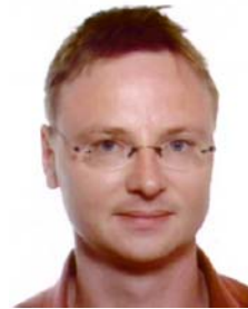
Frédéric BLONDEAU DIC / Culture Janvier 2008